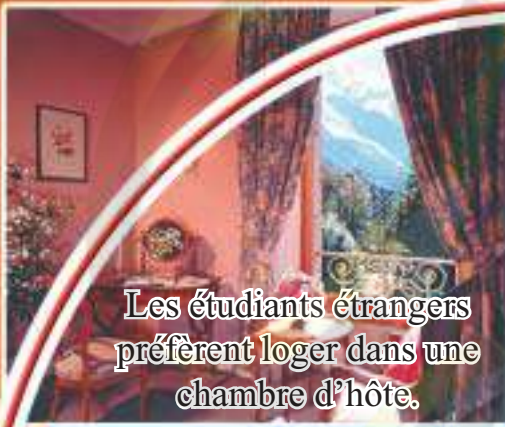
Les étudiants étrangers préfèrent loger dans une chambre d'hôte.