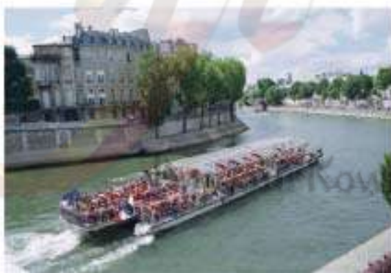
Le bateau mouche