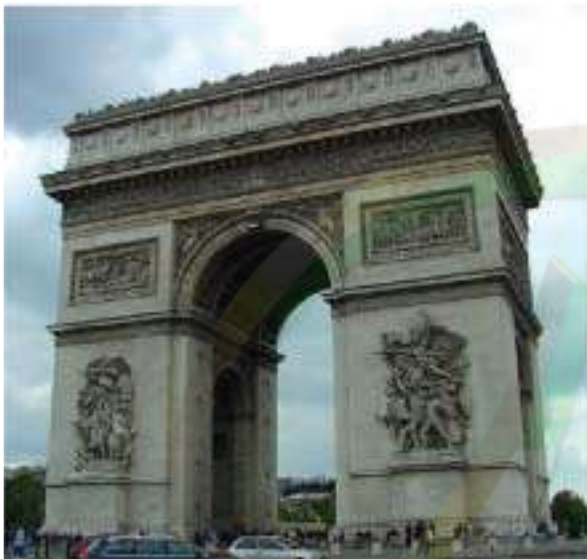
L'Arc de Triomphe

Le matin, monsieur Martin emmène les jeunes à la tour Eiffel: Le monument le plus célèbre à Paris. Ils font la queue depuis 30 minutes.