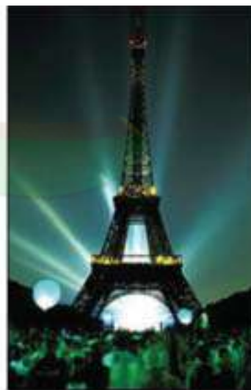
La tour Eiffel