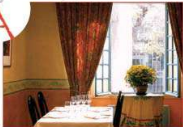
Voilà une table libre à côté de la fenêtre.