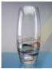
Un vase en verre.