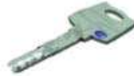
Une clé en métal/fer.