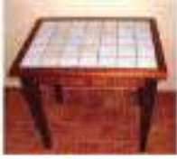
Une table en bois.