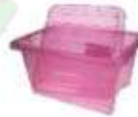
Une boîte en plastique.