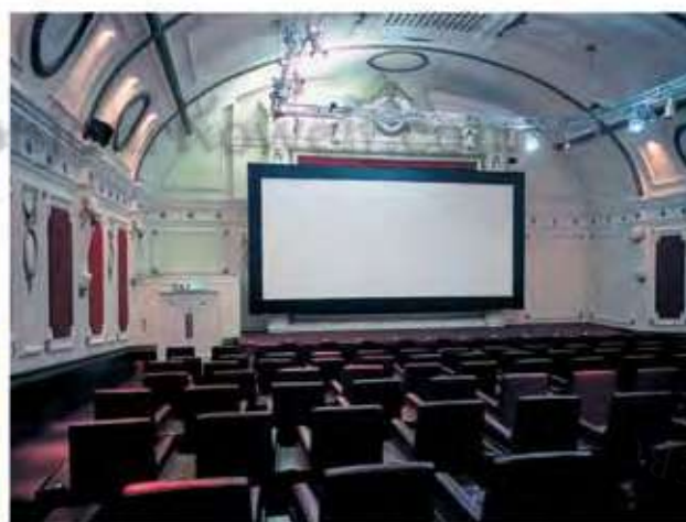
SALLE DE CINEMA