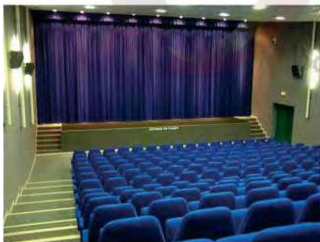
SALLE DE THÉÂTRE