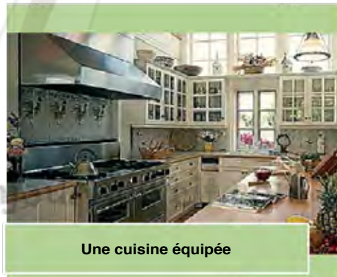
Une cuisine équipée