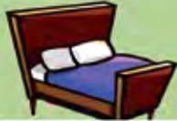
Un lit pour dormir