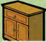
Une commode pour ranger les affaires personnelles