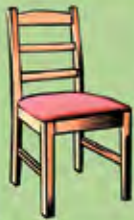
Une chaise pour s'asseoir