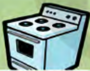
Un four pour cuisiner