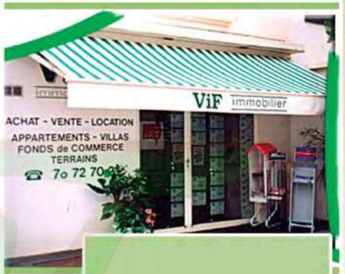
Le agence immobilière