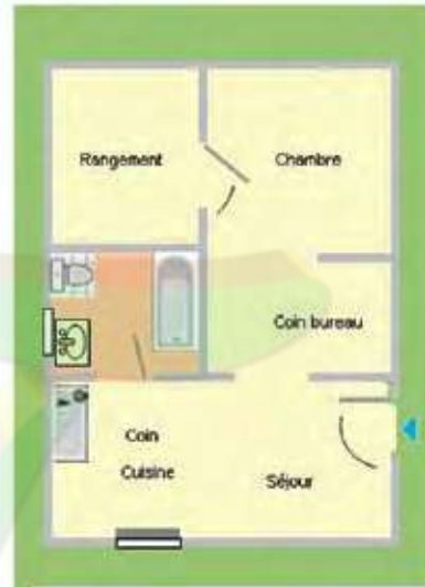
Le plan d'un studio