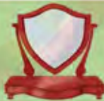
Un miroir pour se regarder