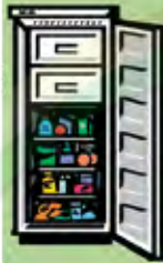
Un frigo pour garder les aliments.